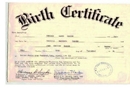
Birth Certificate & picture ID