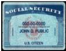
Social security card & picture ID

(2) legal document that proves right to work in the United States, such as the Deferred Action for Childhood Arrivals (DACA) and/or the documents below.